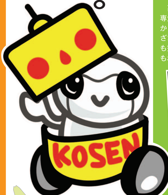
作：福島高専専攻科 会沢清織さん 高専制度創設50周年記念事業共通マスコットキャラクター