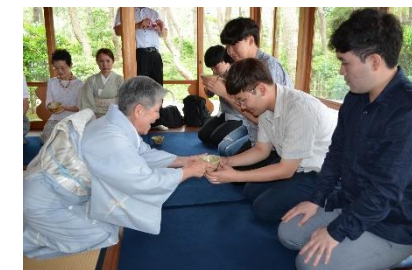
【日本文化体験・茶道】