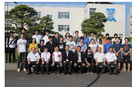
【歓迎会後の集合写真】