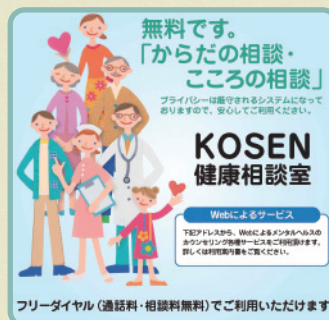
KOSEN健康相談室のポスター

「KOSEN健康相談室」は、国立高専機構が民間の専門機関によるメンタルヘルスサービスを利用して、多くの学生や教職員が気軽に相談できる環境を整備する目的で作られました。従来の学内相談体制に加え、「KOSEN健康相談室」を利用すれば、学生本人およびその家族が無料で電話相談やカウンセリングを受けることができます。