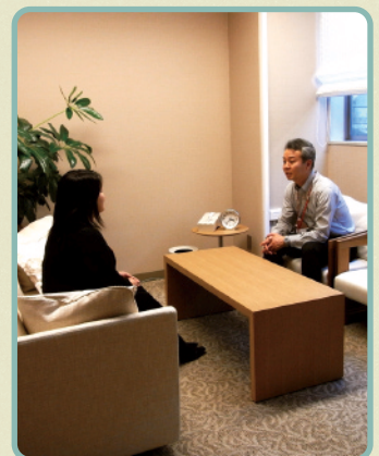
カウンセリングルーム