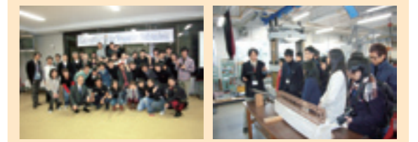
交流会参加者多数 説明に聞き入るポリテクニク学生