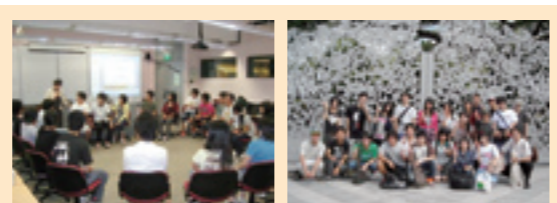
授業風景（英語キャンプ） 現地学生との交流（英語キャンプ）