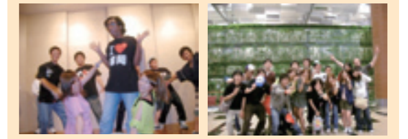
何のパフォーマンス？ みんな元気一杯