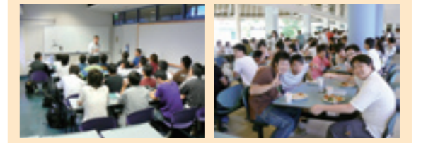
短期英語研修（海外研修旅行） 交流会昼食風景（海外研修旅行）