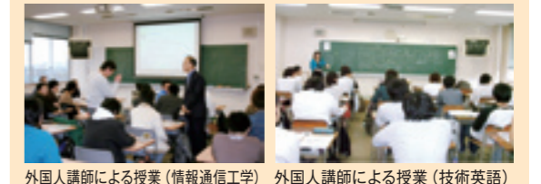
外国人講師による授業（情報通信工学） 外国人講師による授業（技術英語）