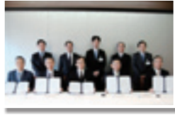
協力各社の代表による調印式

平成21年12月9日に三井物産(株)本店において、次の各企業と「海外インターンシップに関する協定書」の調印式を実施しました。